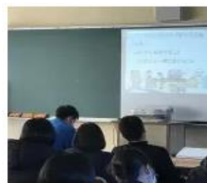
【図4 リモートワークによる防災講話の実施状況】